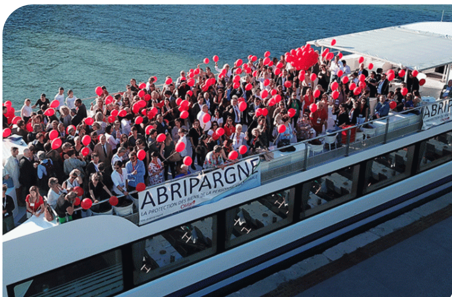
Convention Abripargne - 14/06/2019 - Olifan Group

France TUTELLE a été grandement présente lors de la Convention Abripargne pour, avant tout, porter la voix des familles , au cœur de l'écosystème tutélaire, et s'exprimer sur la place des tuteurs familiaux dans la protection des majeurs protégés, la reconnaissance de leur statut d'aidant et leurs difficultés rencontrées au quotidien.