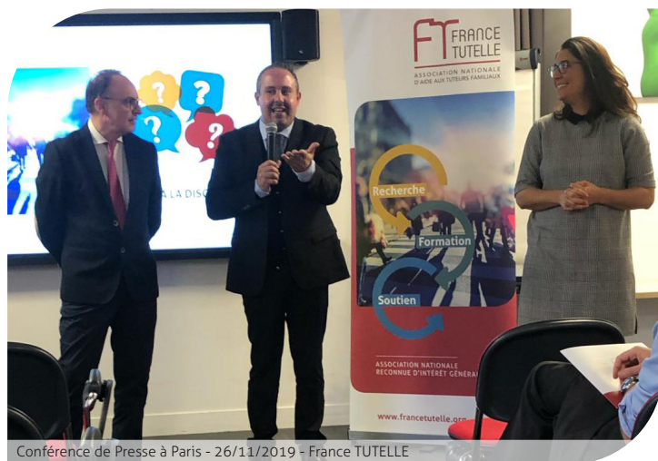
Conférence de Presse à Paris - 26/11/2019 - France TUTELLE

À l'occasion d'une Conférence de Presse à Paris, France TUTELLE a présenté le 26 novembre 2019, les résultats de son Baromètre 2019 - « Regard(s) des Français sur la vulnérabilité et la protection juridique de leur proche »